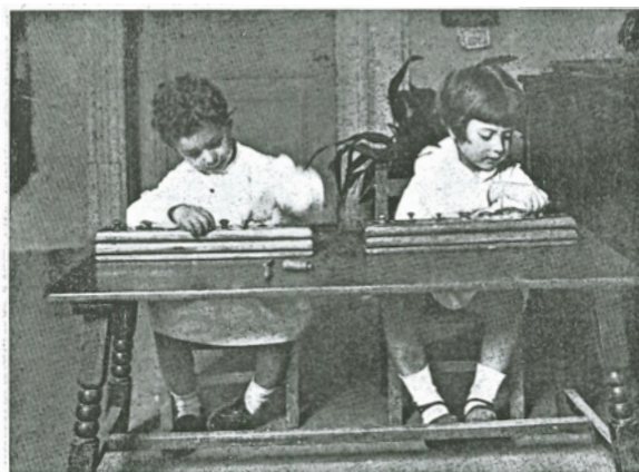
ESCOLA NACIONAL MONTESSORI. ATULF, 12. NENS TREBALLANT AMB ELS ENCAIXOS CILÍNDRICS