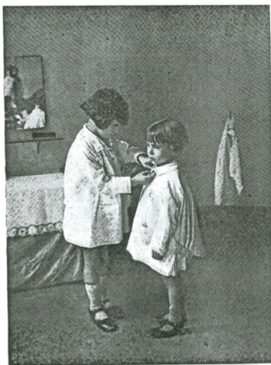
ESCOLA MUNICIPAL MONTESSORI. ATAULF, 12. AJUDA MÚTUA